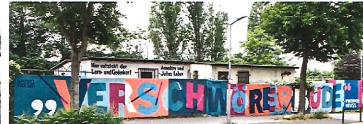
© I. Thaben (Arbeitskreis) – Künstler: Alexander von Freeden

Alle historischen Fotos: Annedore und Julius Leber Archiv